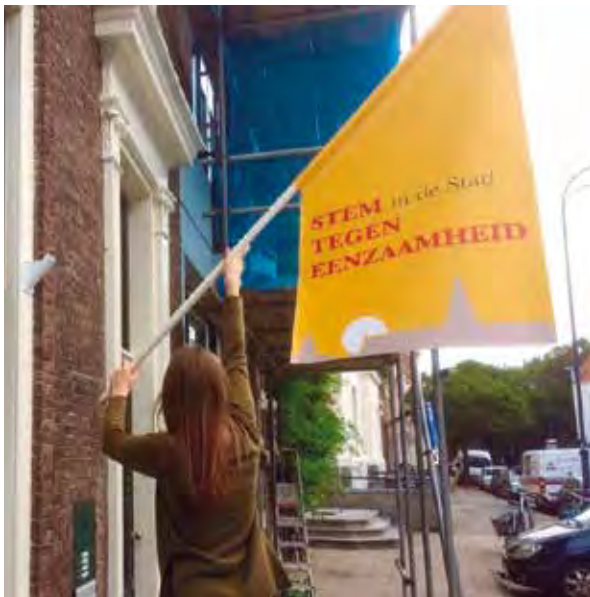
Foto (archief): medewerker van Stem in de Stad hangt de vlag uit voor reclame voor het project tegen Eenzaamheid