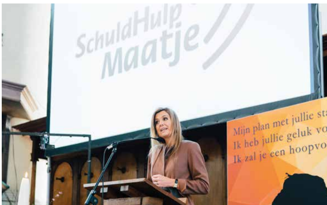
Foto (Vier de Liefde-fotografie): Koningin Maxima op bezoek bij de landelijke vereniging Schuldhulpmaatje

In het begin van het jaar vierde de landelijke vereniging Schuldhulpmaatje het eerste lustrum in de Hooglandse Kerk Leiden in aanwezigheid van Koningin Maxima. Eén van de Haarlemse hulpvragers van het eerste uur, die inmiddels schuldevrij is, heeft aan het publiek verteld hoe hij schulden kreeg, en met hulp van Schuldhulpmaatje weer schuldevrij werd. Hij werd geïnterviewd door de landelijke pers, zoals omroep Max en Blauw Bloed van de EO. Ook werd er een artikel in de Volkskrant geplaatst over het belang van het erkennen van kwetsbaarheid bij schuldhulpverlening.