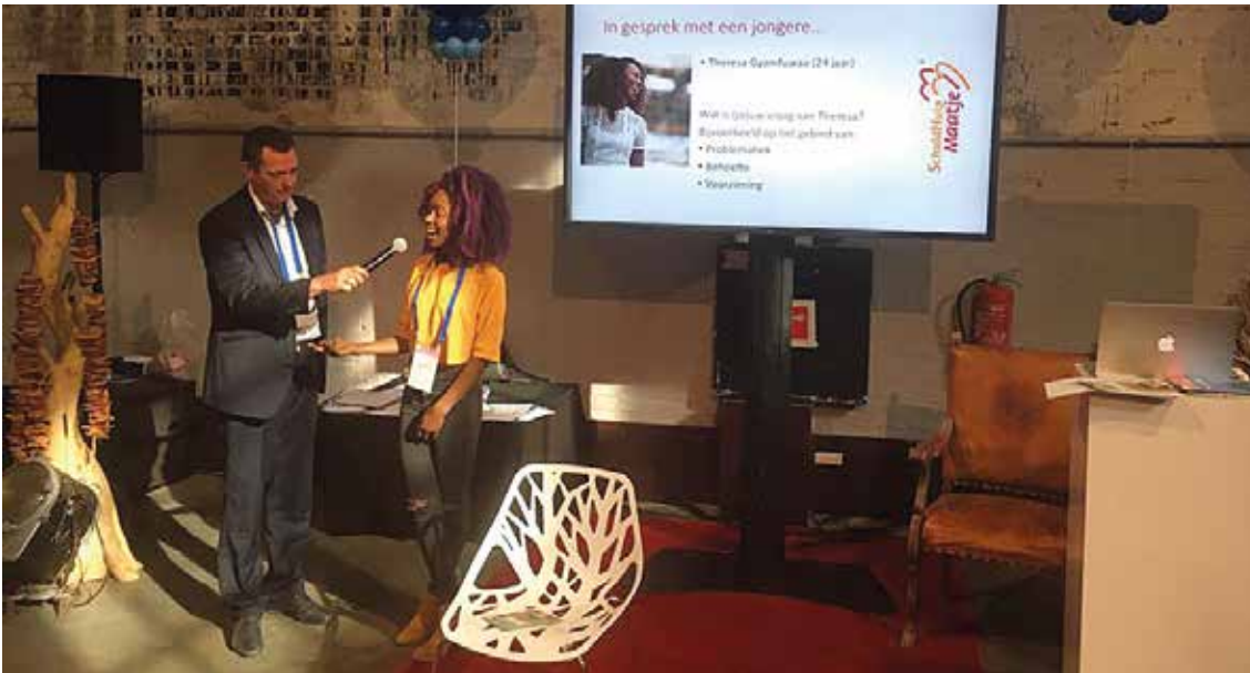
Foto: lancering van MoneyFit in de Westergasfabriek