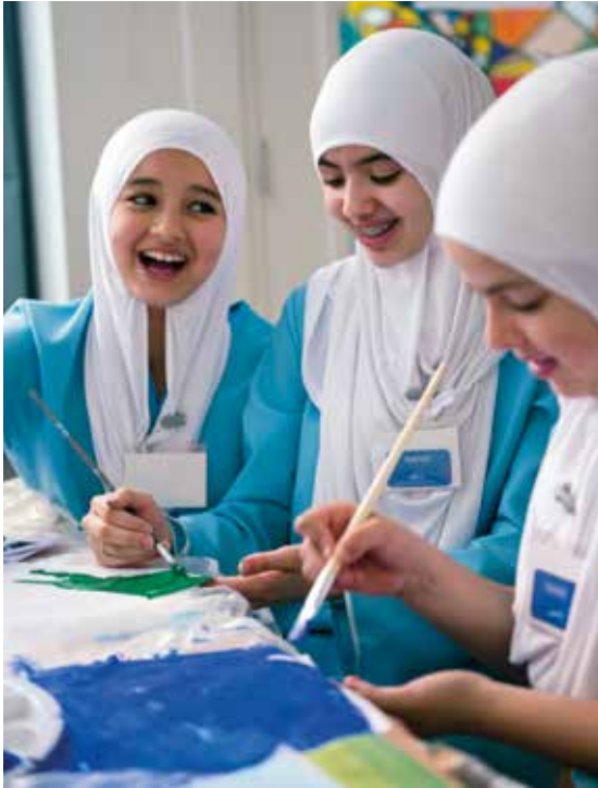
Dag van Hoop