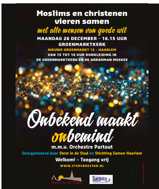
Foto's (archief): Kerstviering van moslims en christenen in de Groenmarktkerk