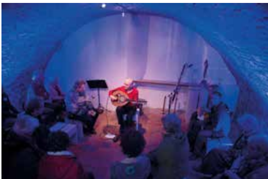
Dag van Hoop, optreden in de kapel van Stem in de Stad

In het voorjaar werd het festival 'Dag van Hoop' georganiseerd voor verbinding tussen alle religies op de wereld. Het centrale thema's was: hoe werken we aan vrede in Haarlem in tijden van mondialisering en media? Er waren maar liefst vierhonderd mensen, die genoten van muziek, interviews, mini-colleges, hapjes en drankjes. Hierdoor werden ontmoetingen tussen de drie godsdiensten op een laagdrempelige manier mogelijk gemaakt.