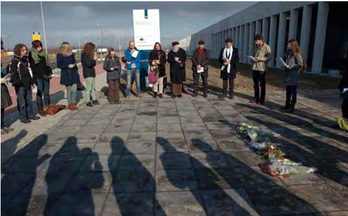
Wake bij de vluchtelingengevangenis op Schiphol

In de tijd voor Pasen organiseerde Stem in de Stad een Schipholwake. Hierbij gaan medewerkers en vrijwilligers naar de vreemdelingengevangenis op Schiphol. Het doel is om mensen die daar gevangen zitten, en niet over de juiste papieren beschikken, een hart onder de riem te steken.